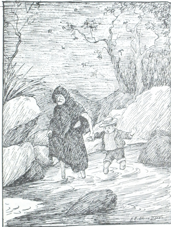
Entramos en el riachuelo