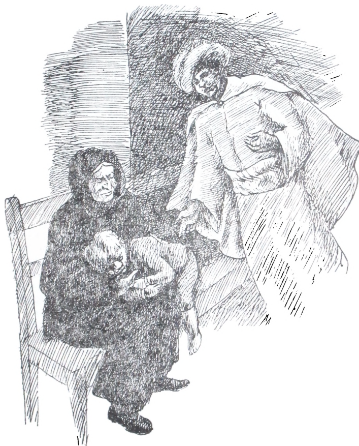
Vi al mismo Rey Baltasar